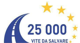
Carta europea della sicurezza stradale

Organizzazione: A.S.D. MOTO CLUB SPINEA, via Bennati n.15/7 30038 SPINEA –VE -Italy www.motoclubspinea-ve.com E-Mail: mcspine@alice.it fax.041.5411447 el.041.990878 cell. 338.6271106