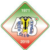
Moto Club Spinea