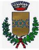
Comune di Spinea